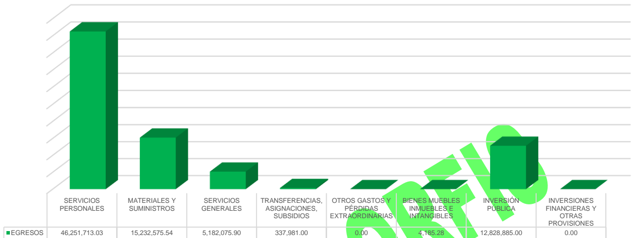
Gráfico 2. Egresos